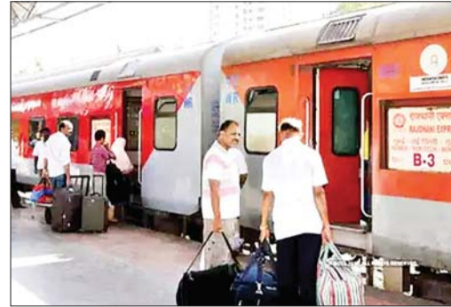
अधिकारियों ने हालांकि कहा है कि देशभर में मालगाड़ी की सेवा बरकरार रहेगी। ऑनलाइन बुकिंग का पैसा खुद मिलेगा इससे पहले, रेलवे ने 22 मार्च से लेकर 31 मार्च तक मालगाड़ी छोड़कर सभी

नयी दिल्ली (ए.)। कोरोना वायरस के बढ़ते प्रकोप के मद्देनजर रेलवे ने मंगलवार को घोषणा की है कि उसकी मेल, एक्सप्रेस तथा पैसेंजर सेवाएं अब 14 अप्रैल तक बंद रहेगी। देशभर में कोरोना वायरस के बढ़ते मामलों पर लगातार लगाए के लिए प्रधानमंत्री नरेंद्र मोदी द्वारा 21 दिनों के देशव्यापी लॉकडाउन की घोषणा के बाद रेलवे का यह कदम सामने आया है।