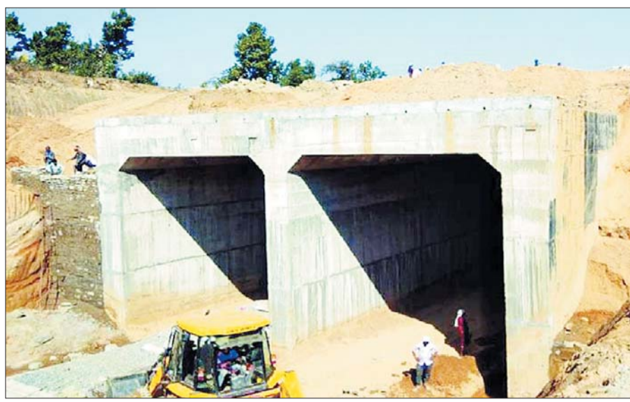
निर्माण के दौरान हाथियों के दल को विचरण करने में किसी प्रकार की कोई परेशानी न हो इसके लिए वन विभाग का अमला भी मदद में जुटा हुआ है। रायगढ़ व धरमजयगढ़ वन मंडल के अधिकारियों का कहना है कि विकास के लिए रेल लाइन का विस्तार काफी आवश्यक है, लेकिन जिस तकनीक से निर्माण हो रहा है उससे हाथियों व जंगल के अन्य चयन

कही जा रही है। बताया जा रहा है कि इस क्षेत्र में जहां काफी मात्रा में जंगल का क्षेत्र आ रहा है तो वहीं भारी संख्या में बड़े-बड़े उद्योग भी स्थापित हैं। इससे रेलवे मंत्रालय और स्टेट गर्वमेंट दोनों को भारी भरकम राजस्व मिलेगा। इस रेल लाइन के विस्तार के लिए राज्य से लेकर केंद्र तक की पूरी नजर है। निर्माण की लगातार मॉनीटरिंग की जा रही है। निर्माण के दौरान हाथियों के दल को विचरण करने में किसी प्रकार की कोई परेशानी न हो इसके लिए वन विभाग का अमला भी मदद में जुटा हुआ है। रायगढ़ व धरमजयगढ़ वन मंडल के अधिकारियों का कहना है कि विकास के लिए रेल लाइन का विस्तार काफी आवश्यक है, लेकिन जिस तकनीक से निर्माण हो रहा है उससे हाथियों व जंगल के अन्य चयन